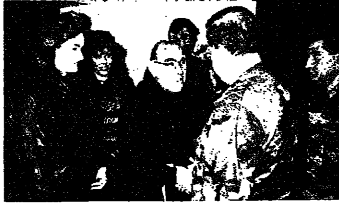
ومع أحد الوفود الشعبية